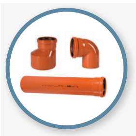
cevi in fazonski kosi