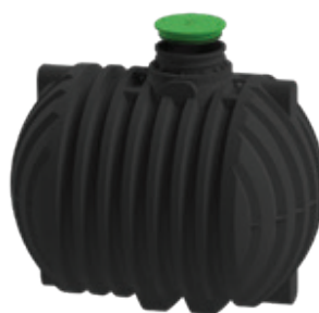
ZA ODPADNO VODO