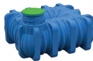
AQUAstay FLAT ZBIRALNIK

Zbiralnik za deževnico, pitno in odpadno vodo je zbiralnik s konstrukcijo, primerno za vkop v zemljo. V naši ponudbi imamo številne različice ležečih izvedb, s celotnim naborom dodatne opreme, vse od tesnil, črpalk, filtrov, itd. Zbiralniki so izdelani po rotacijskem postopku iz polietilena in so 100 % neprepustni. V ponudbi tudi zbiralniki za pitno in odpadno vodo.