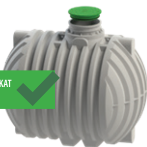
ZA PITNO VODO