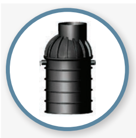
oljni lovilci in lovilci maščob